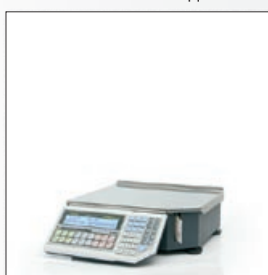
«ШТРИХ-ПРИНТ» ФІ 4.5

Серия весов с печатью этикеток «ШТРИХ-ПРИНТ» 4.5 — превосходная комбинация проверенной электроники, выдержавшей испытание временем, и нового привлекательного дизайна — эстетичного и практичного. Для различных сфер применения — от фасовки и работы через прилавок до самообслуживания — разработано несколько исполнений весов, отличающихся расположением блоков индикации и клавиатуры. Линейка весов версии 4.5 включает в себя 4 модели.