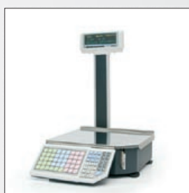
«ШТРИХ-ПРИНТ» М 4.5