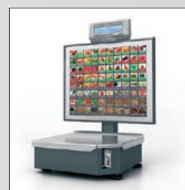
«ШТРИХ-ПРИНТ» С 4.5

Весы «ШТРИХ-ПРИНТ» ФІ 4.5 — исполнение, предназначенное для фасовки товара. Клавиатура и дисплей оператора размещены внизу. Дисплей покупателя не предусмотрен.